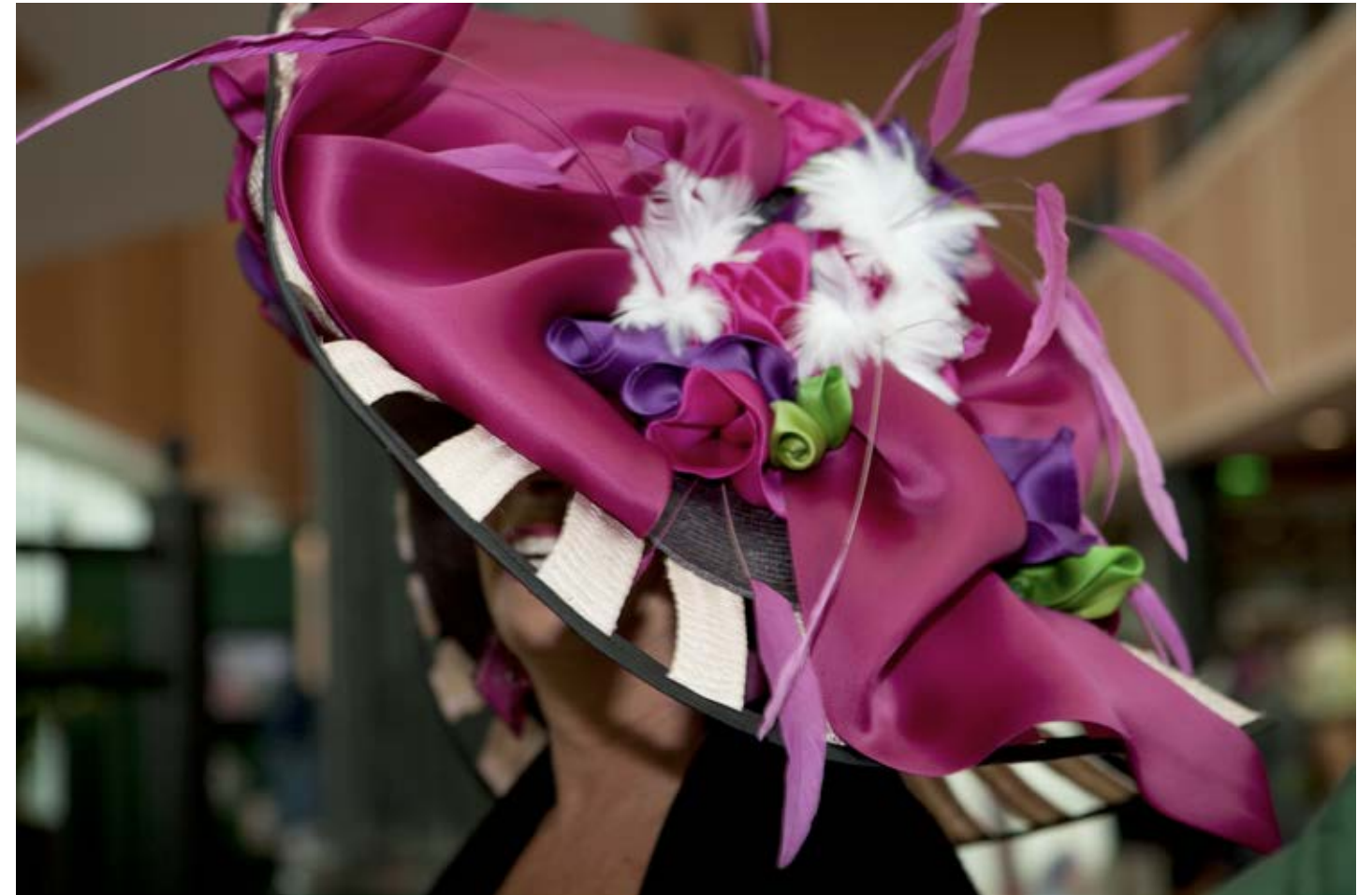
Derby Winner (Kentucky Derby) 2011, C-print, 83.8 x 125.7 cm