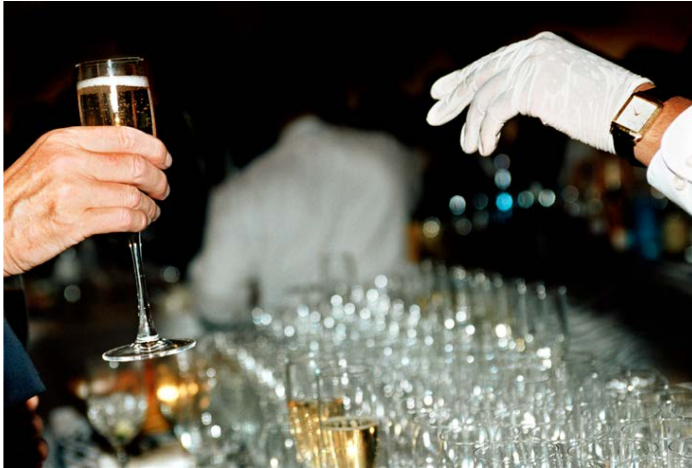
Safe Champagne (Southampton Hospital Benefit Gala) 2007, C-print, 60 x 91 cm