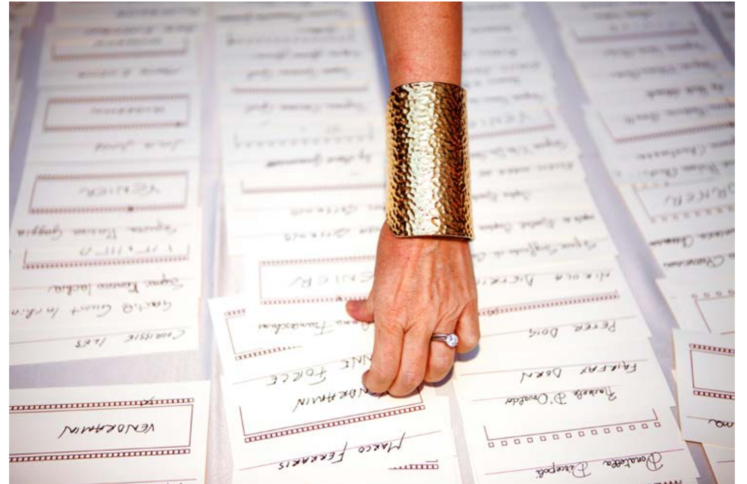
Cuffed (Venice Biennale) 2011, C-print, 83.8 x 125.7 cm