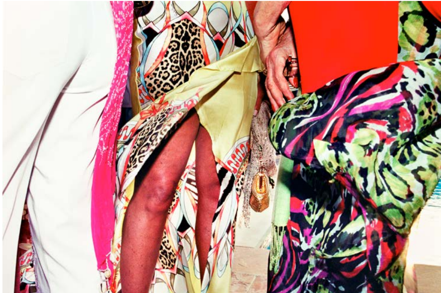
Party Animals (Cancer Benefit, Southampton) 2006, C-print, 121.5 x 183.5 cm