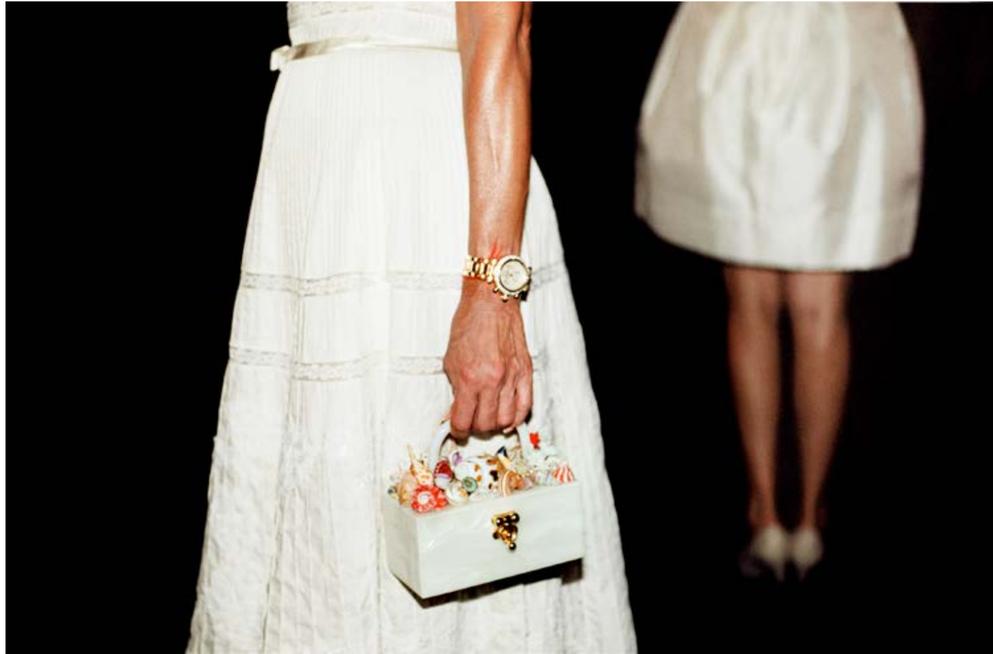
The Answer is White (Southampton Hospital Benefit Gala) 2007, C-print, 60 x 91 cm