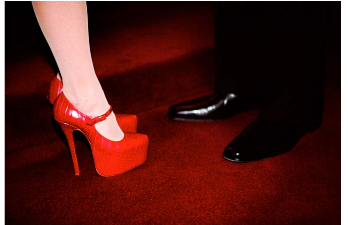
The Red Shoes (YSL Gala, Lincon Center, New York City) 2009, C-print, 83.8 x 128.8 cm