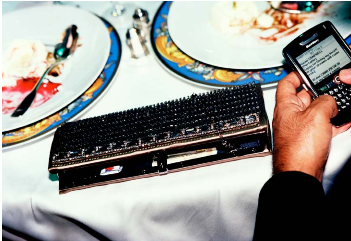
All Your Dreams Will Come True (AmfAR Benefit, Cannes) 2008, C-print, 63.5 x 91.4 cm