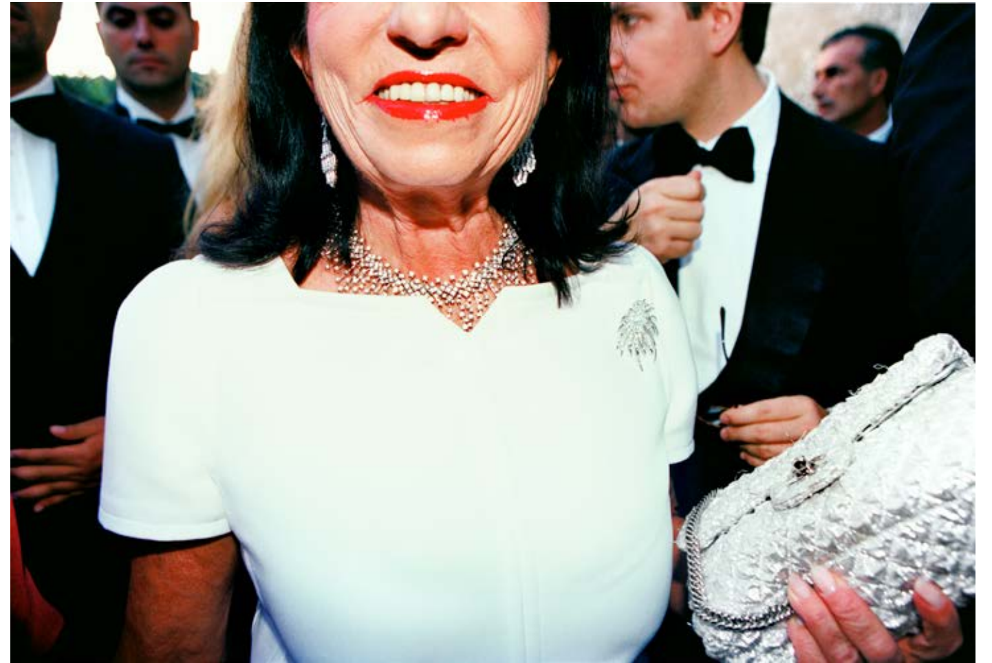
Arrival Lipstick (AmfAR Benefit, Cannes) 2008, C-print, 62.5 x 91 cm