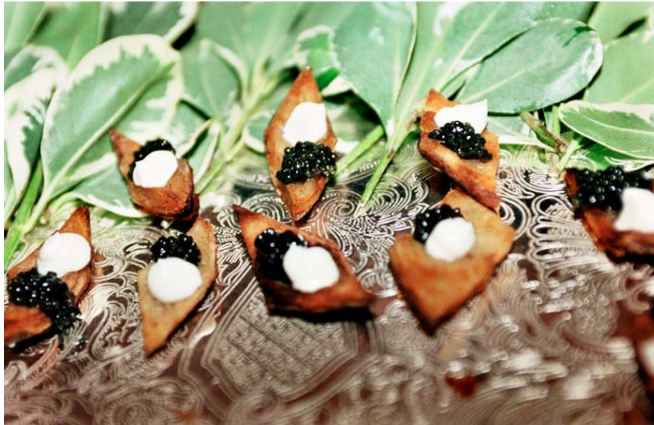
Catered Caviar (Southampton Hospital Benefit Gala) 2007, C-print, 59.5 x 91 cm