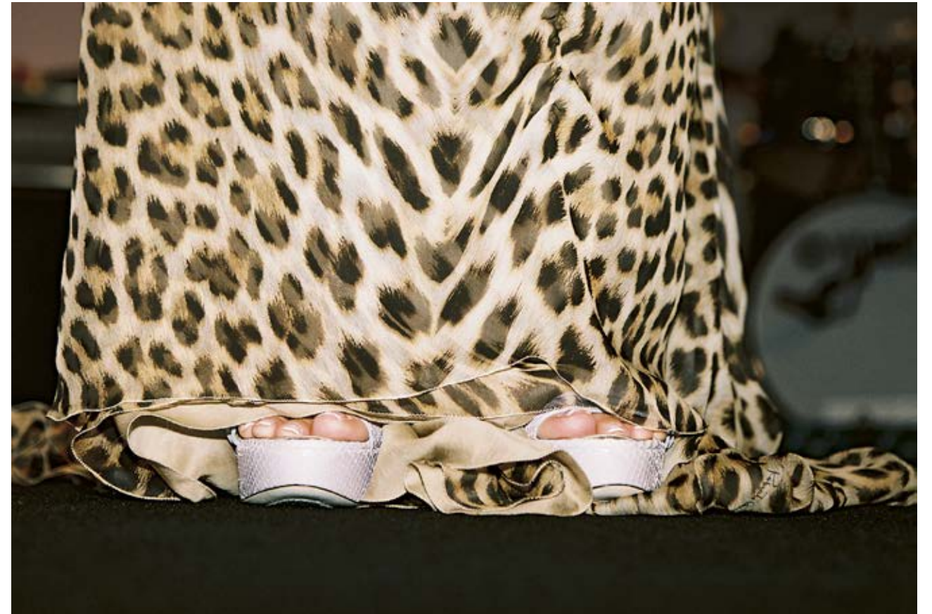
Jungle Fever (AmfAR Benefit Gala, Cannes) 2009, C-print, 83.8 x 124 cm