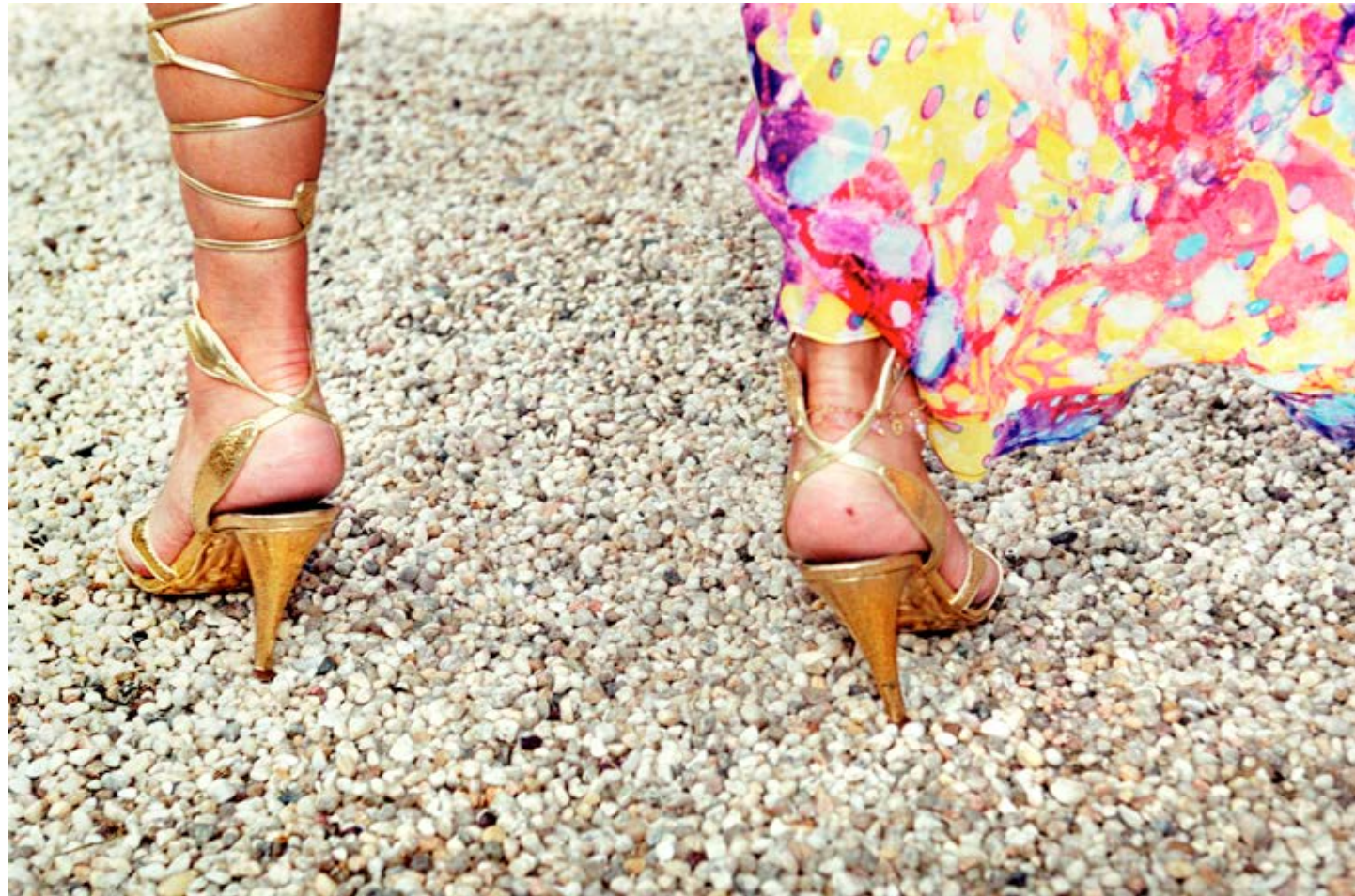
Driveway Gladiator (Cancer Benefit, Southampton) 2006, C-print, 60 x 91 cm