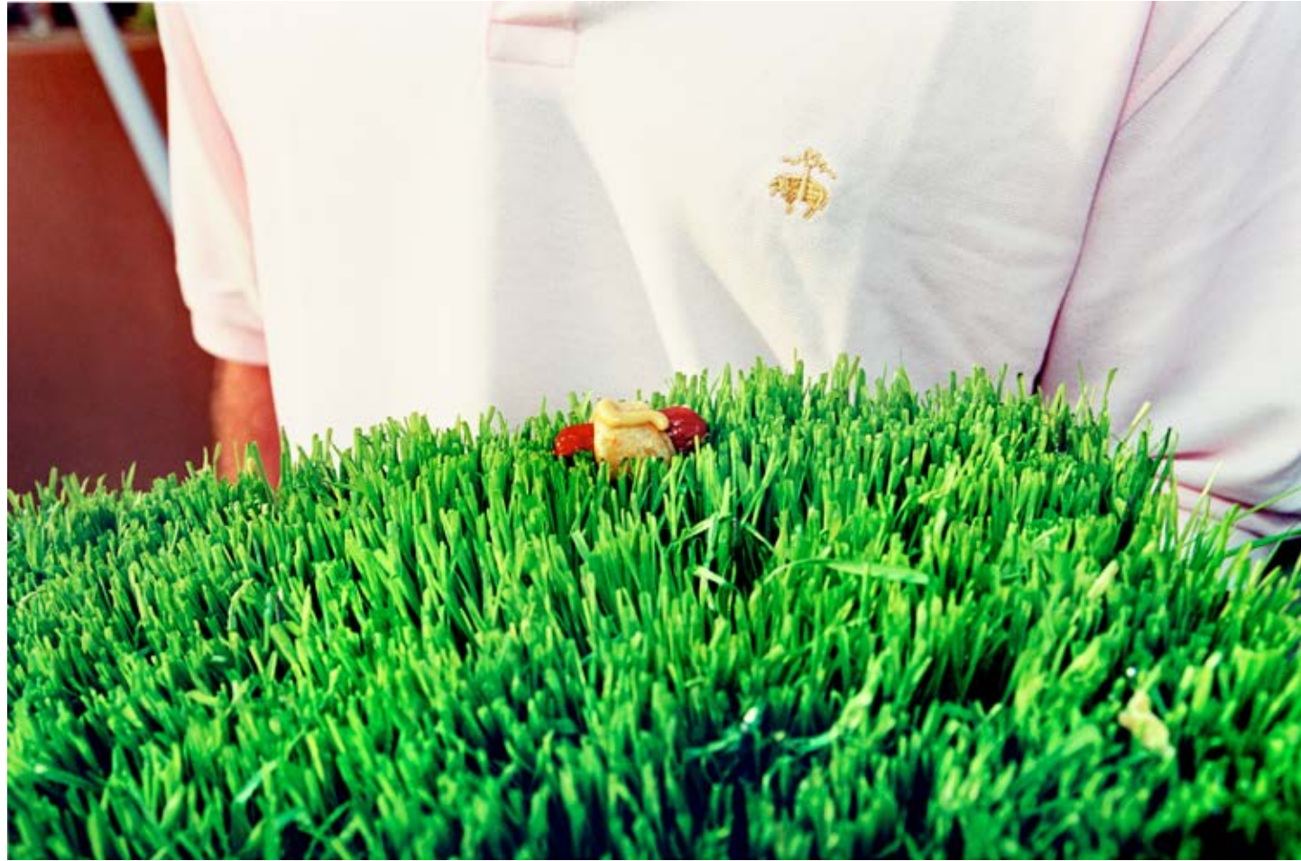
Brooks Brothers Weiner (Cancer Benefit, Southampton) 2006, C-print, 60 x 91 cm