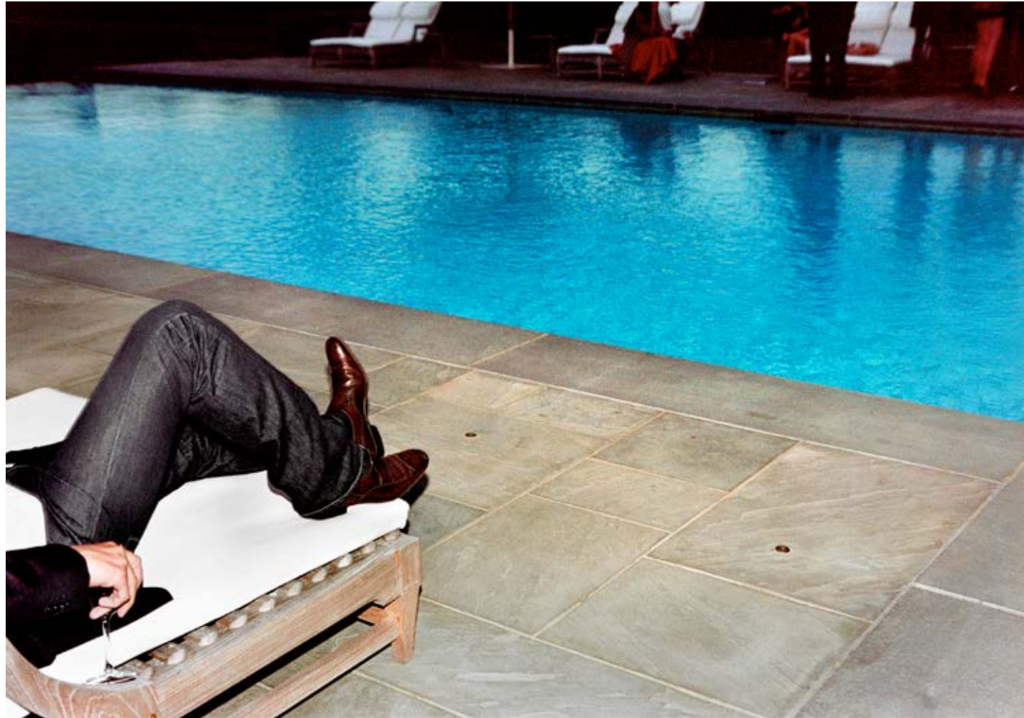
New Jeans, New Pool (Real Estate Brokers Party, Southampton) 2007, C-print, 62.5 x 91 cm