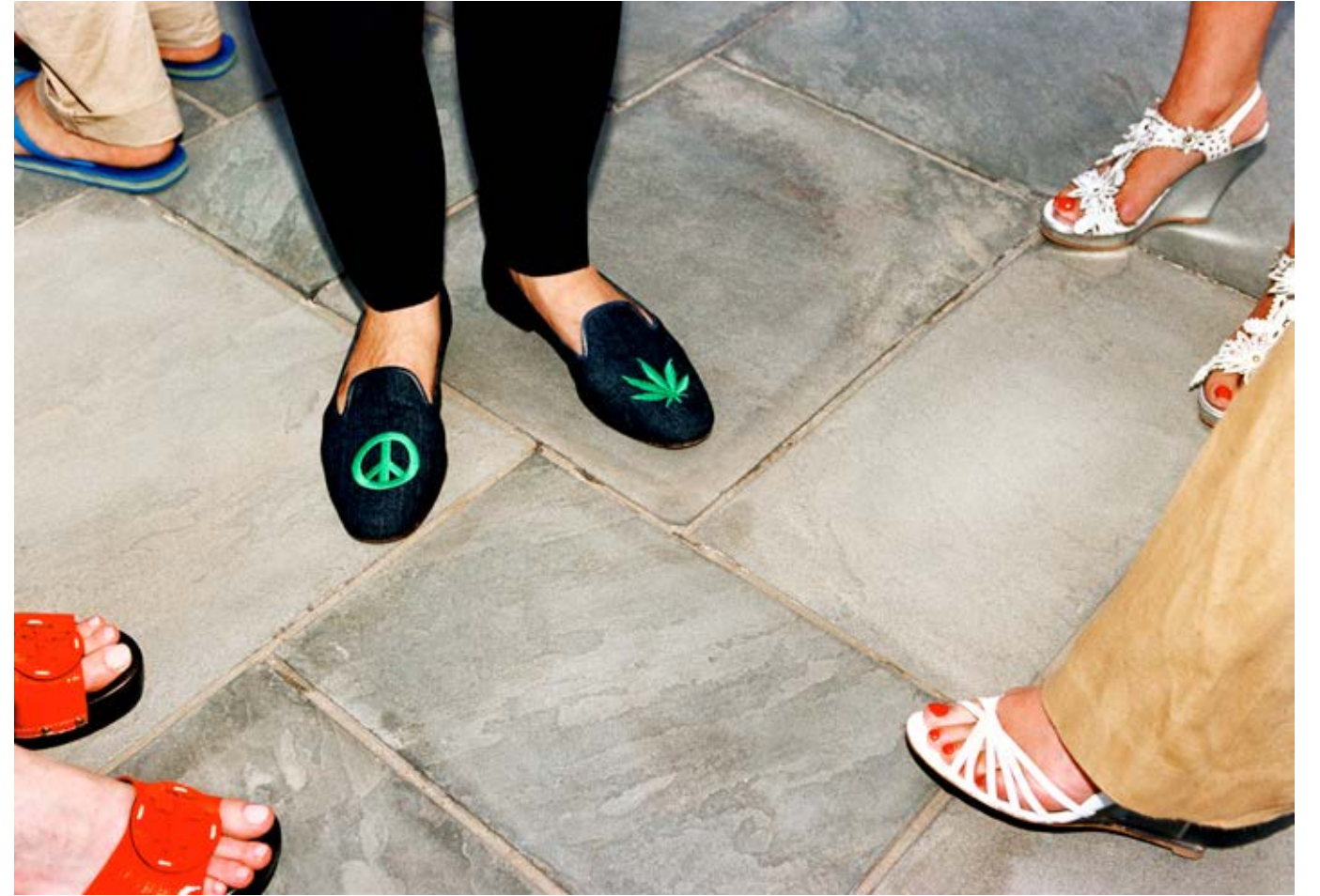
The End of the Revolution (Real Estate Brokers Party, Southampton) 2007, C-print, 63.5 x 91 cm