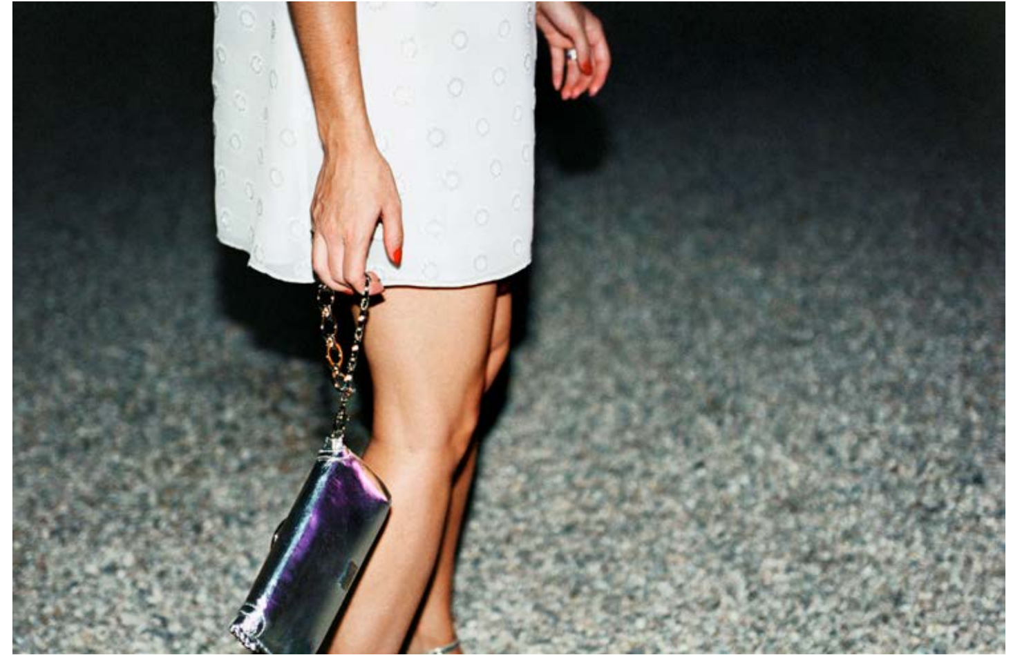
Town Car to Tent (Watermill Center Benefit Gala, Watermill) 2007, C-print, 83.8 x 127.3 cm