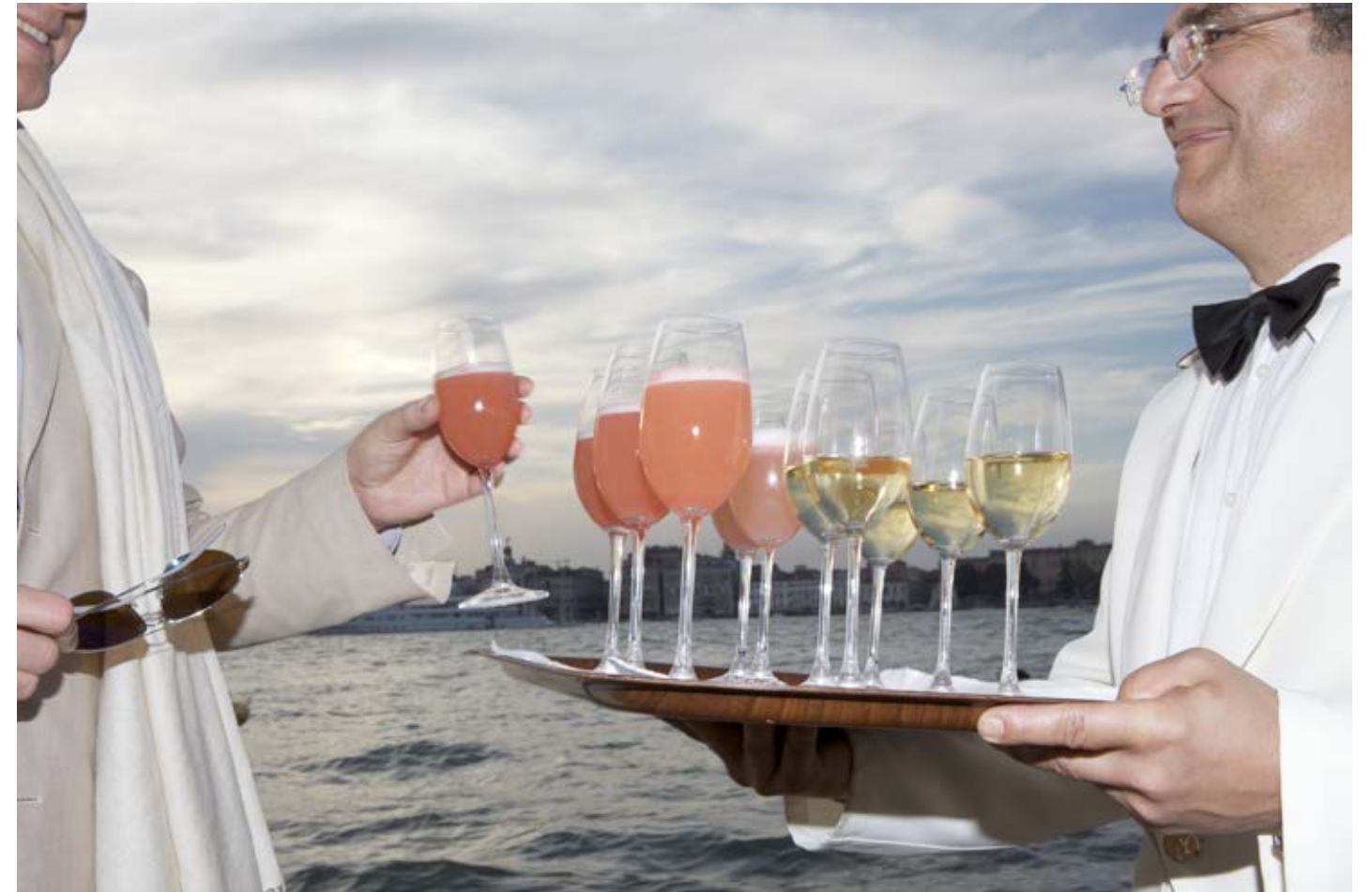
Another Bellini? (Cipriani Dolce, Venice) 2011, C-print, 83.8 x 128.3 cm