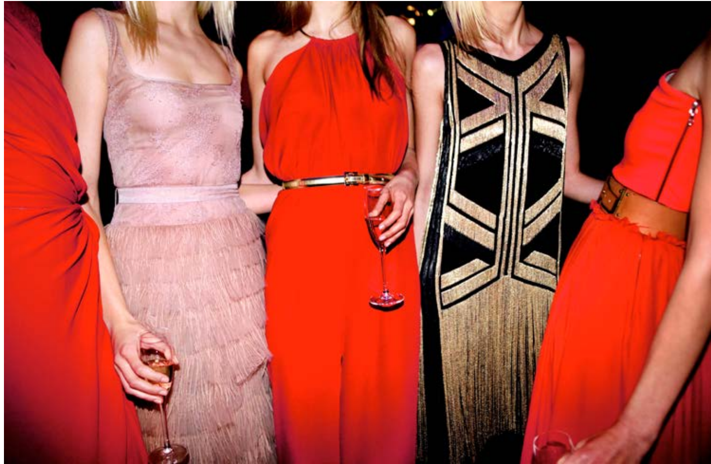
Midnight at the Oasis (AmfAR Benefit Gala, Cipriani Wall Street) 2012, C-print, 83.8 x 128.8 cm