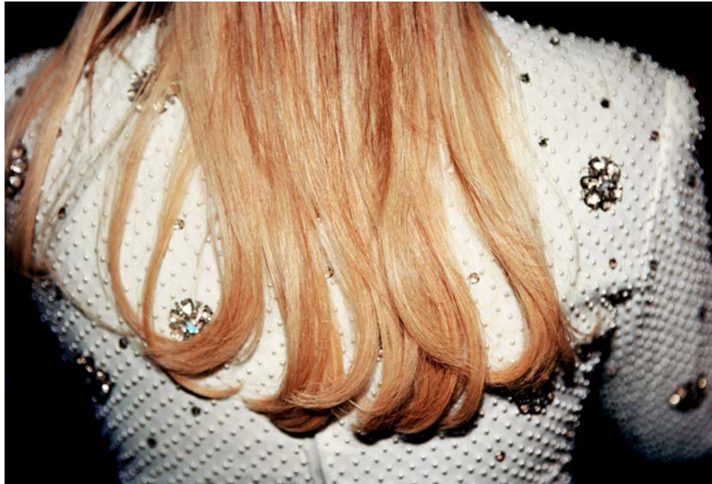
Pearly Queen (Child Abuse Benefit, New York City) 2009, C-print, 83.8 x 123.4 cm