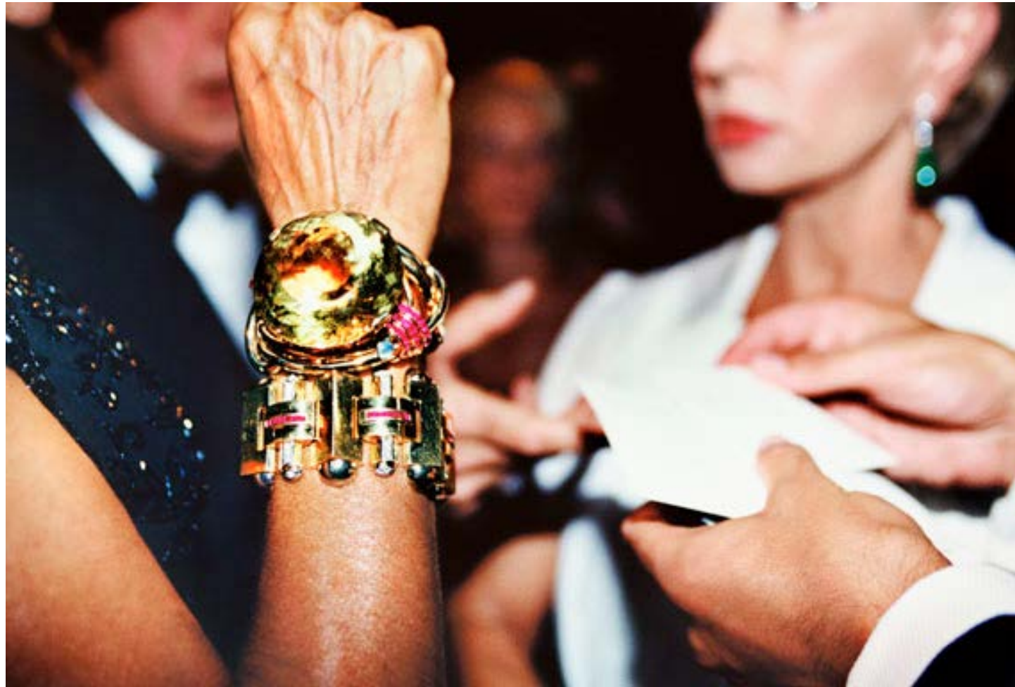
Fisted (Ralph Lauren 40th Anniversary Party, New York City) 2007, C-print, 83.8 x 124 cm