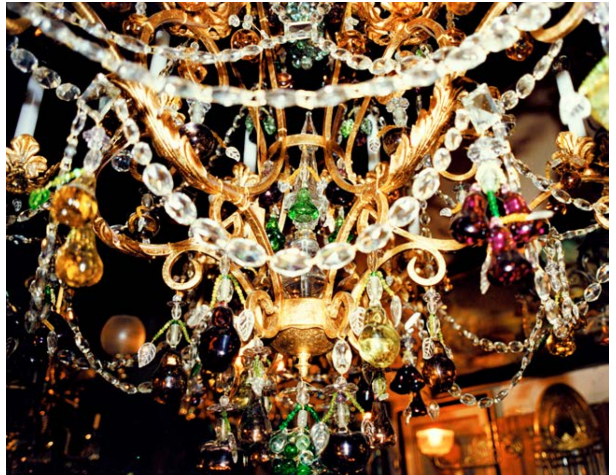
Private Party (Casa Rosada, Buenos Aires) 1998, C-print, 83.8 x 106.8 cm